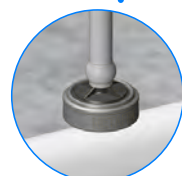
PCJ オンライン ドリッパーと