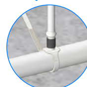
ユニラムと ニップルアダプターで